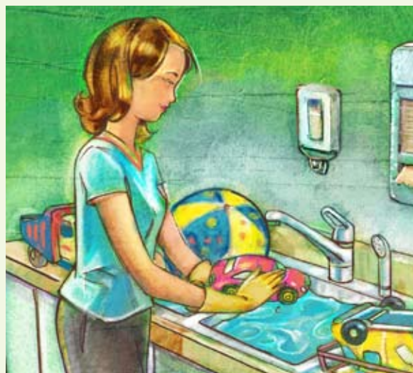
Illustration : François Couture

« Désinfectez et dites adieu aux microbes et aux infections », Sans Pépins, vol. 4, n° 4, décembre 2002, p. 1-5.