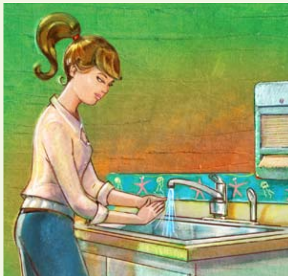
Illustration : François Couture